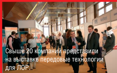
Свыше 20 компаний представили на выставке передовые технологии для ЛОР.